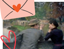
image un sentiment aussi intime et personnel ? Quelles méthodes et matériaux les artistes ont utilisé pour exprimer leur vision de l'amour ? Venez donc le découvrir à l'occasion de cette Micro-Conférence spéciale Saint-Valentin !