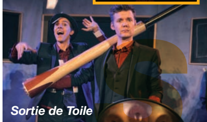
Sortie de Toile