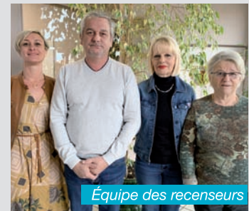
Équipe des recenseurs

Autant de bonnes raisons pour leur réserver un bon accueil ! ●