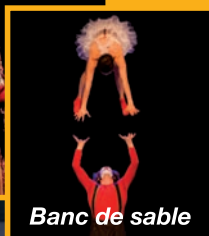
Banc de sable